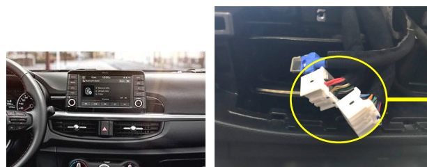
Vista connettore uscita cavi - Connector view: wires