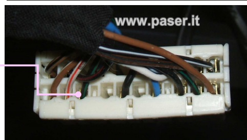
CONNESSIONI DI LOGICAN LOGICAN CONNECTIONS