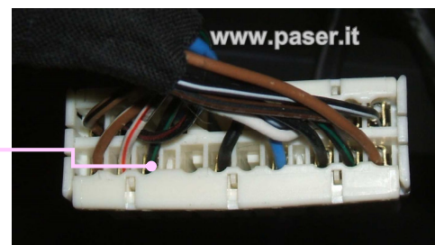
CONNESSIONI DI UNICOM UNICOM CONNECTIONS

BEHIND THE CAR RADIO THERE IS THE OEM RADIO CONNECTOR. PLEASE CONNECT PINK WIRE OF THE MODULE TO THE GREEN/BLACK WIRE (POS. 16).